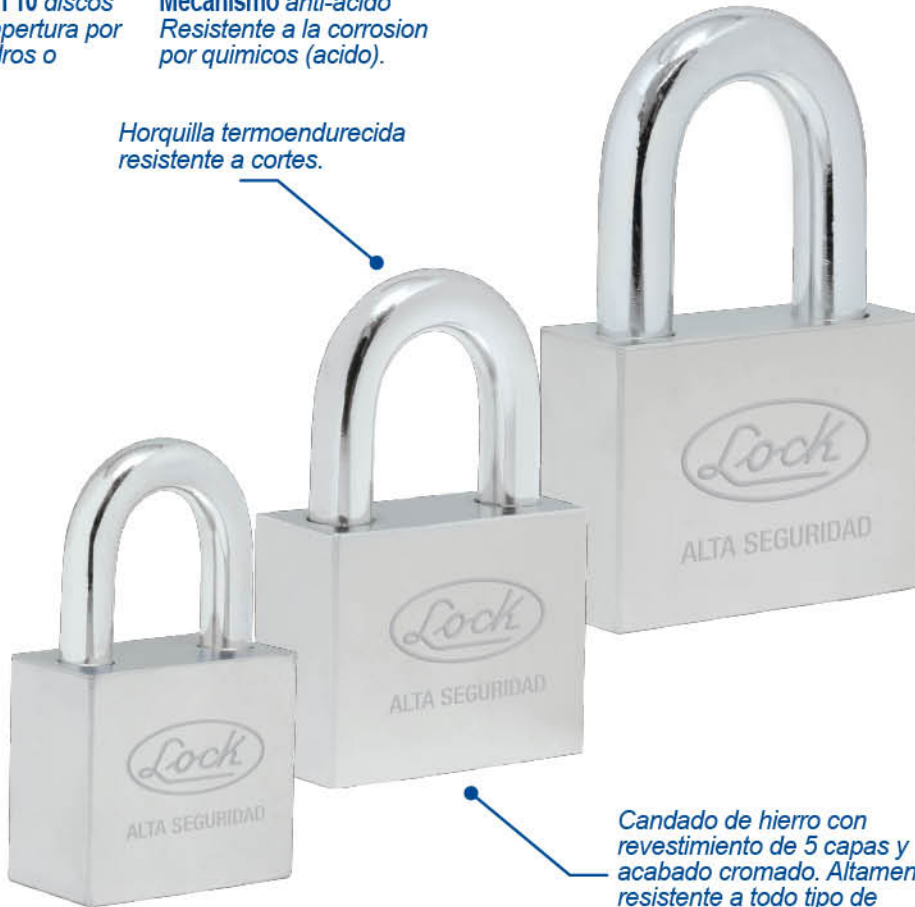
Candado de hierro con revestimiento de 5 capas y acabado cromado. Altamente resistente a todo tipo de ataques físicos.