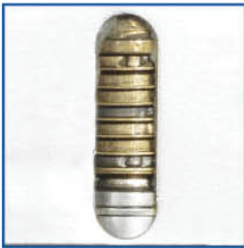
Mecanismo con 10 discos que evitan la apertura por ganzuas, taladros o llaves allen.