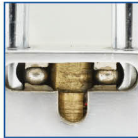
Mecanismo anti-ácido Resistente a la corrosión por químicos (ácido).