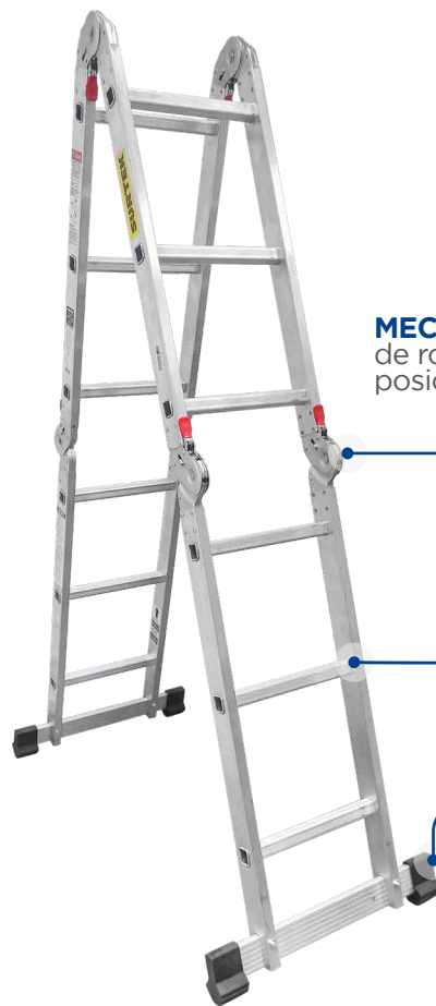
MECANISMO de rodilla de posición.