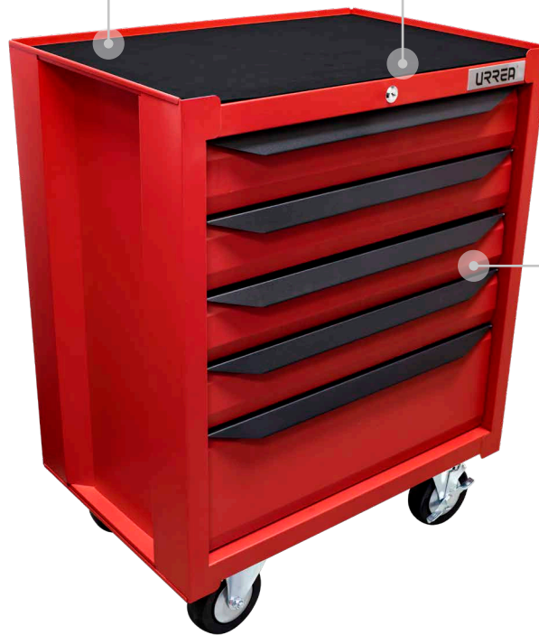
GAVETAS con jaladeras.