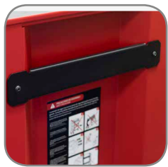
ASA LATERAL uso rudo.