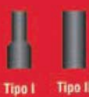
Tipo I Tipo II

• Cuadro hembra con ranura y barreno con la finalidad de colocar un perno y un anillo al trabajar con herramienta de poder.