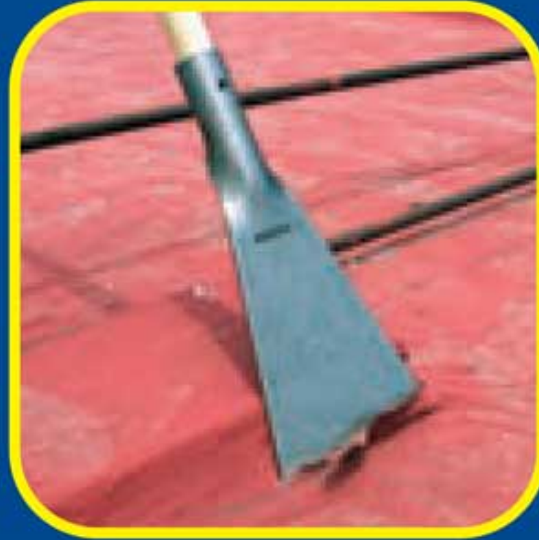
Remover impermeabilizantes, pisos asfaltos etc.