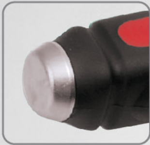
Casquillo de impacto unido a la barra. Permite al usuario golpear el extremo sin dañar el mango.